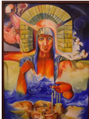
וְהִנֵּה אִישׁ-אֶחָד לְבוּשׁ בְּדִים... = (דניאל י' 5)

וְהִנֵּה-אִישׁ מֵרָאֵהוּ כְּמַרְאֵה נְחֹשֶׁת... (יחזקאל מ' 3) = הציור נמצא באתר: www.rami-nir.com = "תקוות".