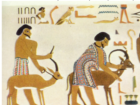
קטע זה של ציור הקיר כולל את שם אֶבְיָשִׁי והמספר 22 + 15 = 37

סיכום הפענוח: [אל-ישר]=[15+22]=[ישראל] משמר תיעוד למסר היסטורי המתאר את רידת יַעֲקֹב למצרים, בכתובת שיוחסה ליוסף "צִפְנַת פְּעֻנַח" ותוארכה לשנת 6 למלכות פרעה ח'-חיפר, בציור הקיר במקדש קבר הנסיך חנוס חותפ' II.