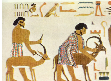
קטע זה של ציור הקיר כולל את שם אֶבְיִשִי והמספר 22 + 15 = 37

שְׁימור כַּמּוֹת: [אל-ישר]=[22+15]=[ישראל] משמר תיעוד למסר היסטורי המתאר את ירידת יַעֲקֹב למצרים, בכתובת שיוחסה ליוסף "צִפְנַת פְּעִנַח" ותוארכה לשנת 6 למלכות פרעה ח'-חיפר, בצירוף הקיר במקדש קבר הנסיך חנוס חותפ' II.